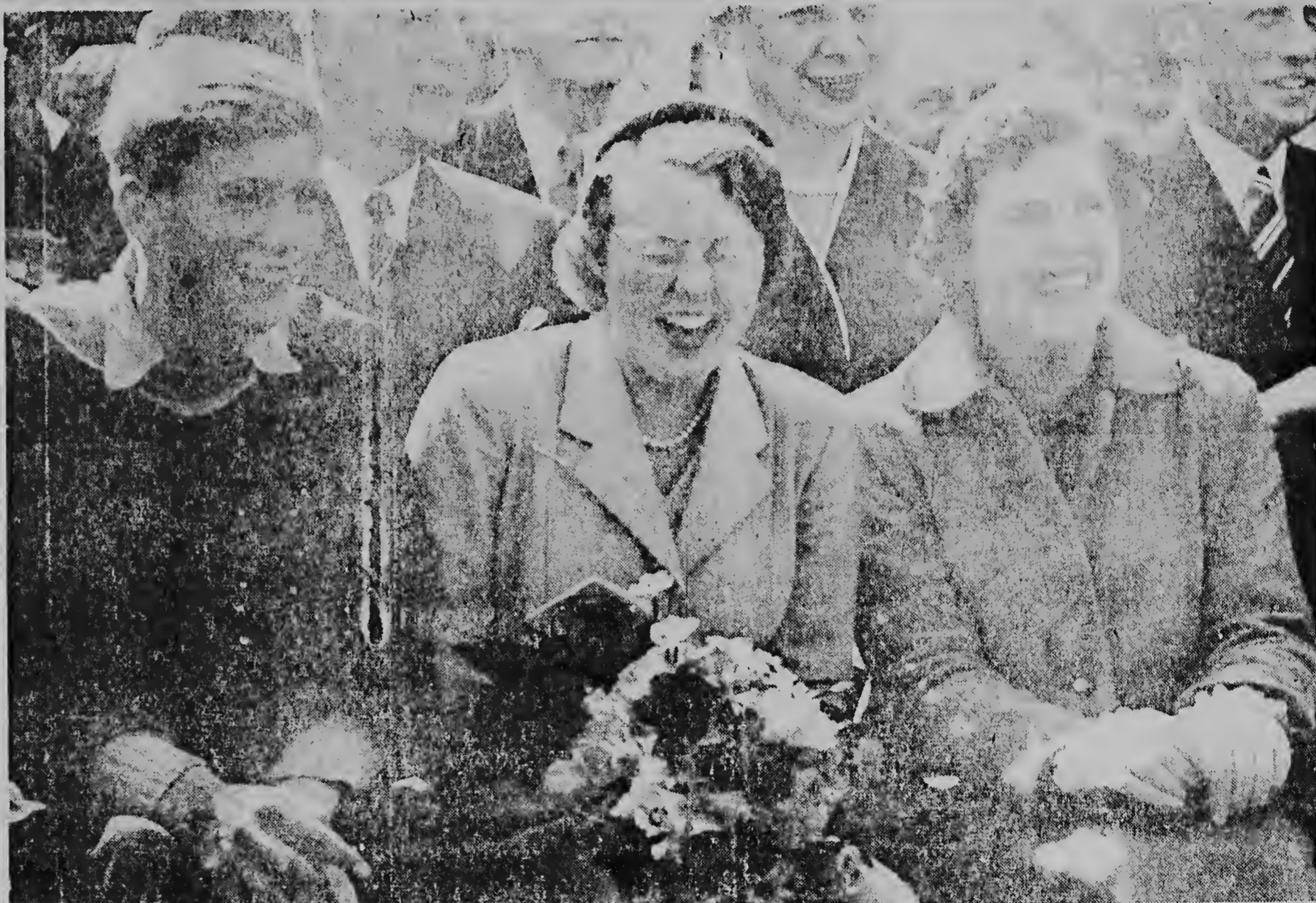
Prinses Beatrix henterando. Un harenta duro y natural durante di un demonstracion na 1956 coe a wordo teni na su honor. Ken a bini na observacion di un aña na ta conta halvez e henteramento nobos ey banda di die.